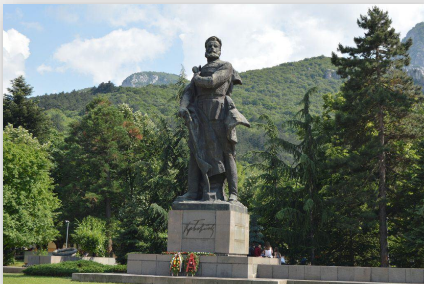
Паметник на Христо Ботев

Всеки ученик представи своите избрани забележителности и ни запозна с най-важните исторически факти за тях.