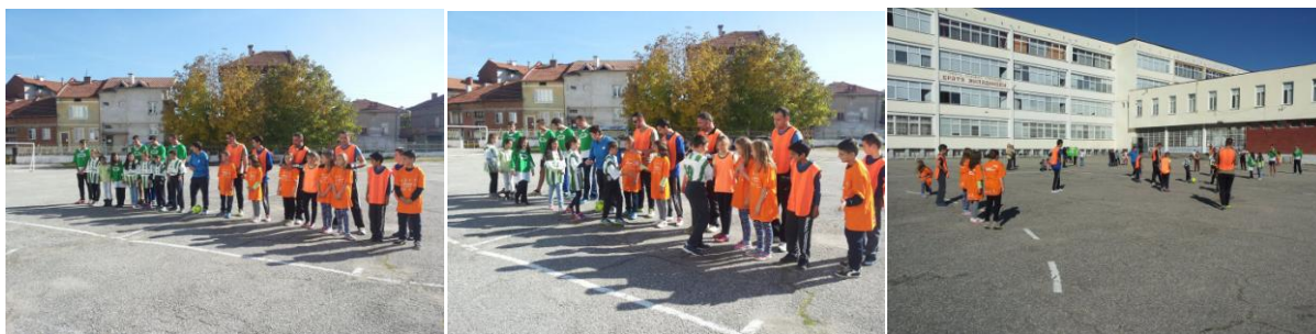
Футболно дерби в двора на ЗОУ между бащи и деца – 2016г.