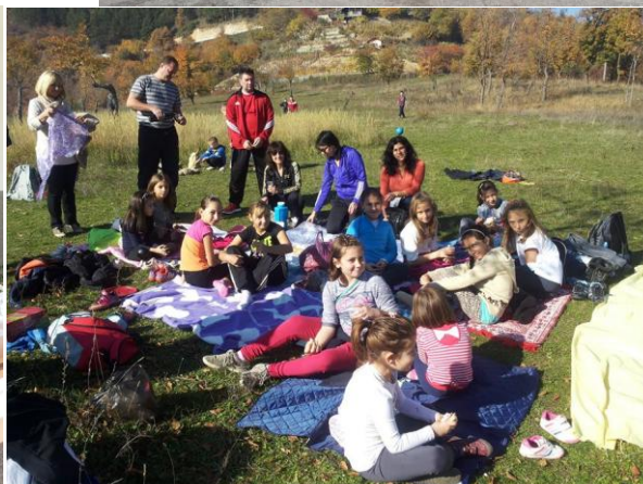
Първата снимка: Участие и съорганизиране на между училищен конкурс „Най-красиво пролетно цвете“. Втората снимка: Пролетен пикник с родители, организиран от УСД ЗОУ.