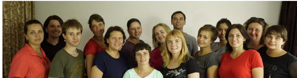
Фонд «Приобщаващи практики», Грузия