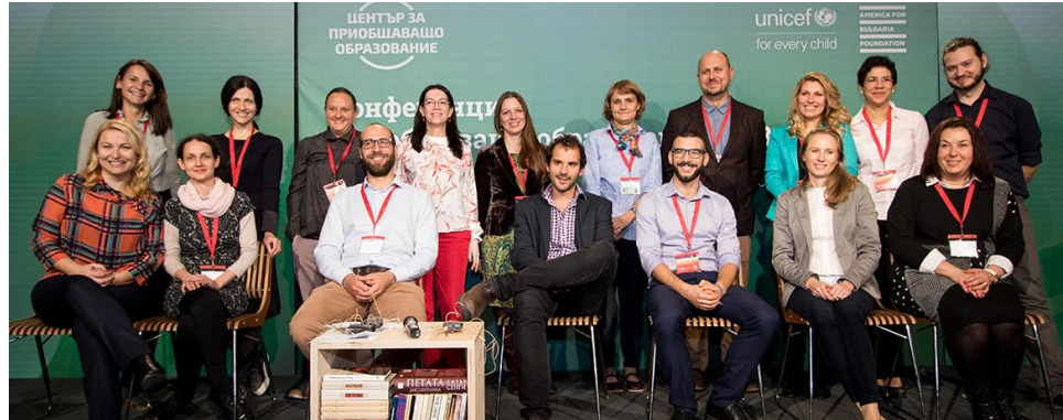
Център за приобщаващо образование, България